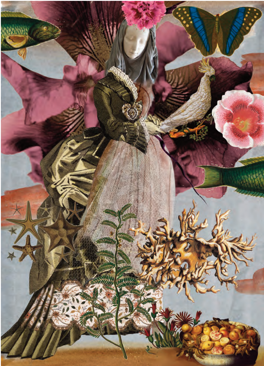
Christian Lacroix, Hommage à Joseph Delteil (2018)